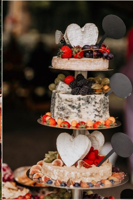
Styling: Brilljant Wedding