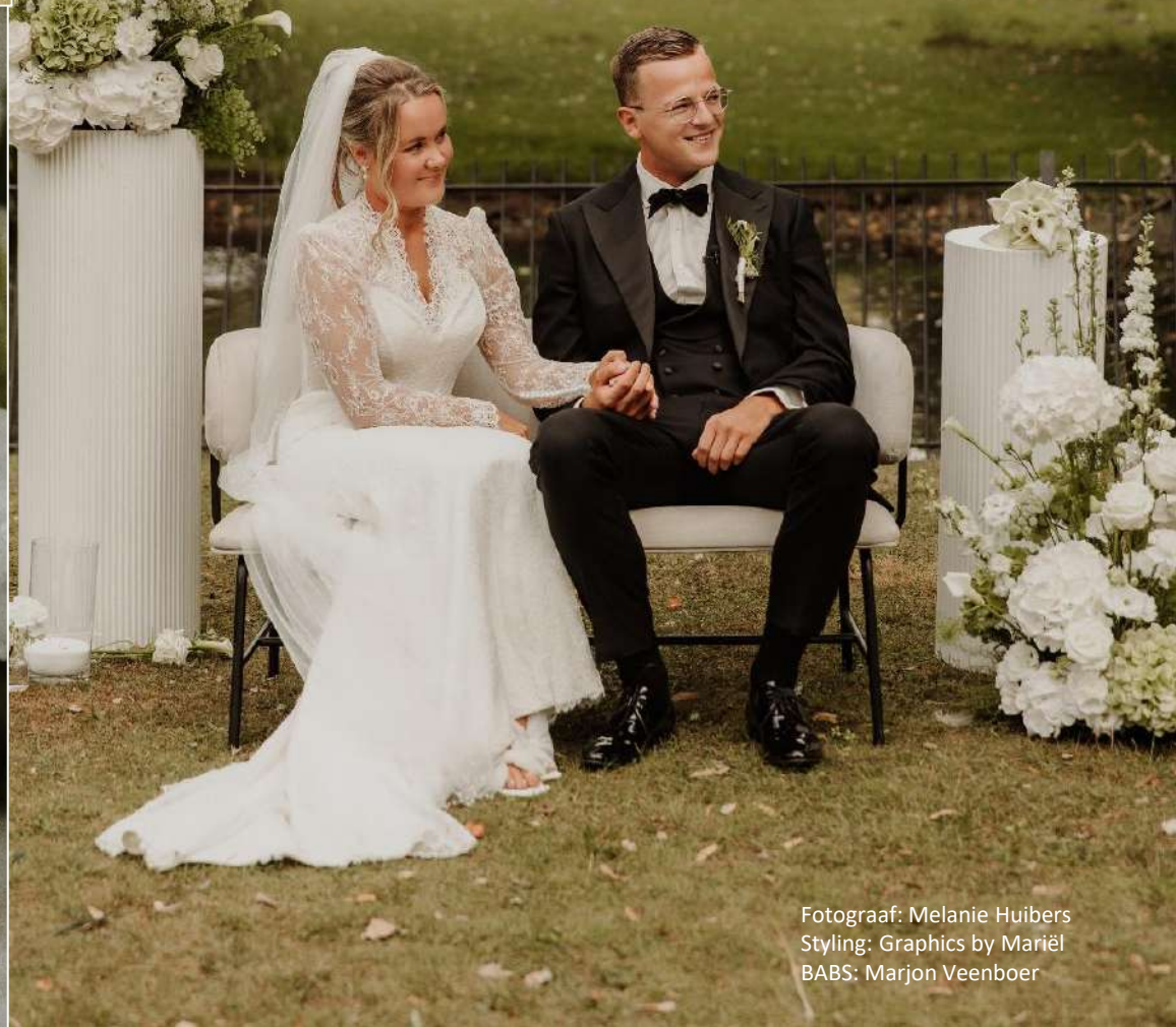
Styling: Graphics by Mariël BABS: Marjon Veenboer