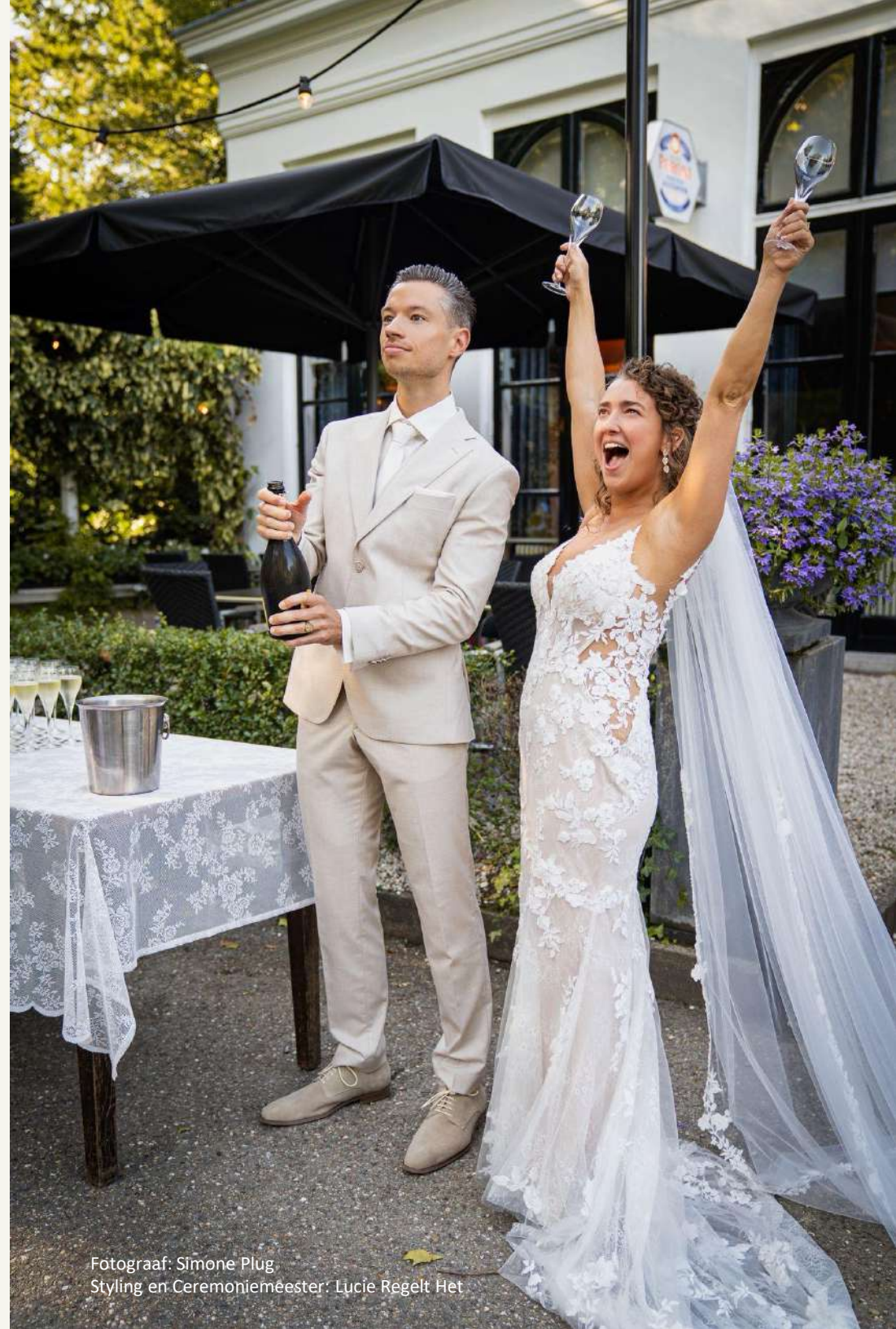
Styling en Ceremoniemeester: Lucie Regelt Het