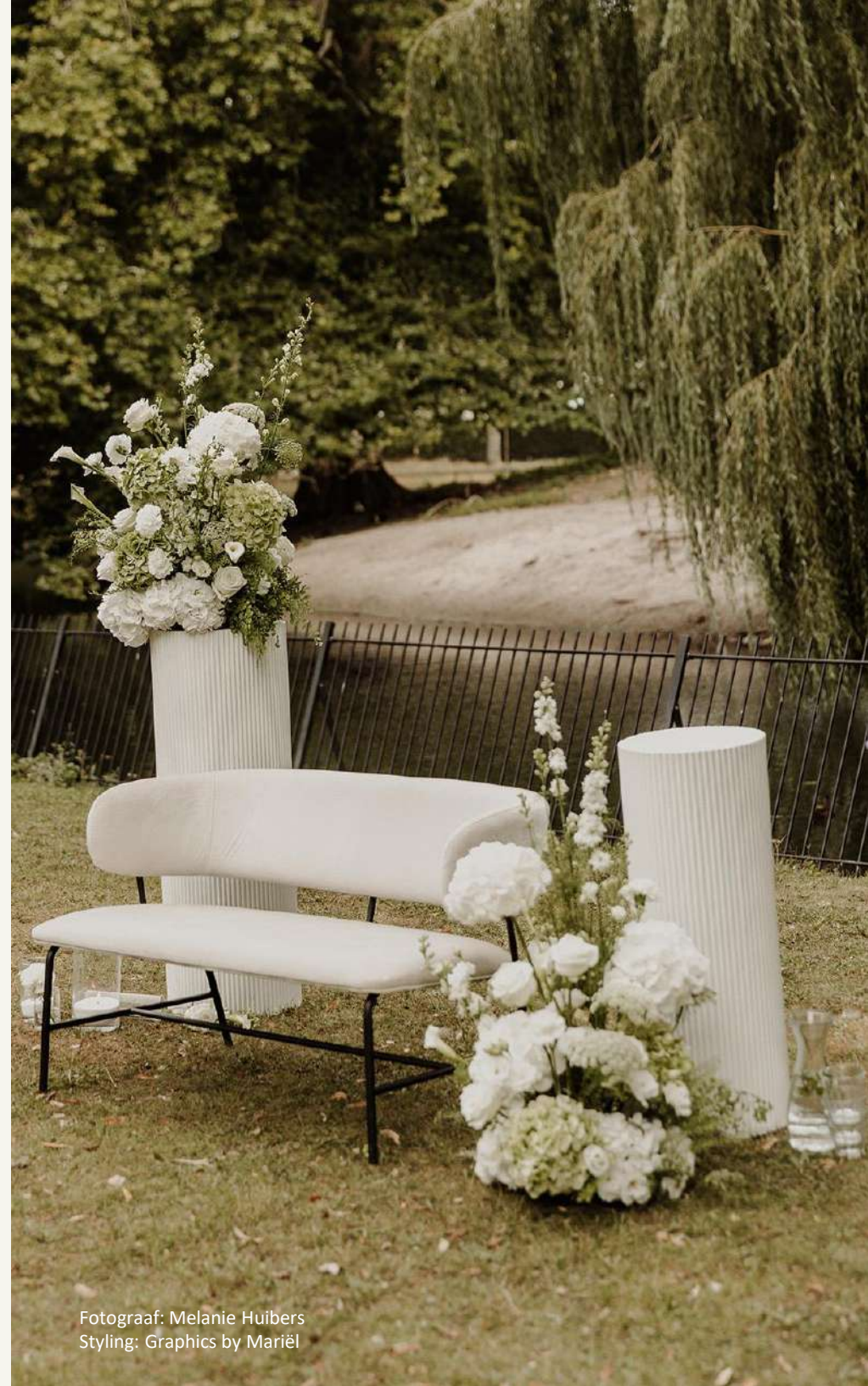
Styling: Graphics by Mariël

Park Velserbeek is goed bereikbaar per auto, fiets of met het openbaar vervoer. Het park beschikt over ruimschoots gratis parkeerruimte.