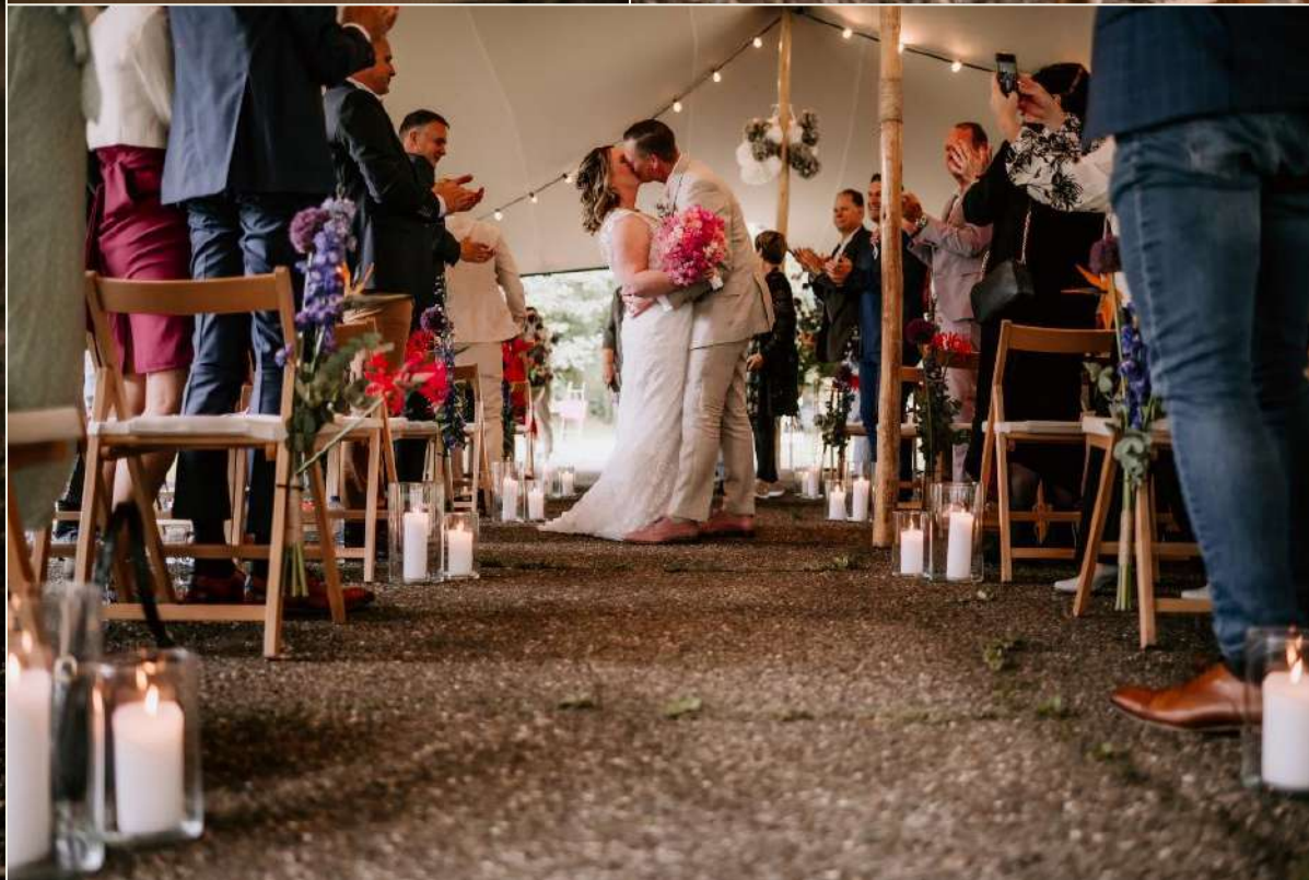
Styling: Briljant Wedding