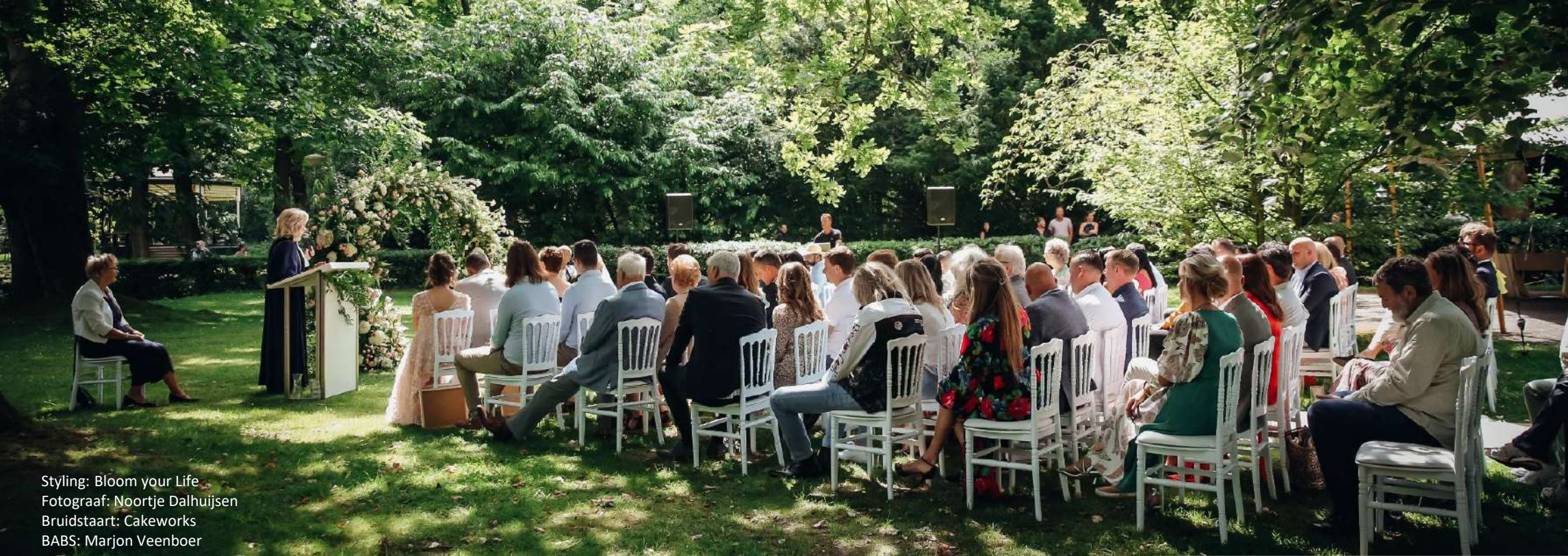
Styling: Bloom your Life Bruidstaart: Cakeworks BABS: Marjon Veenboer