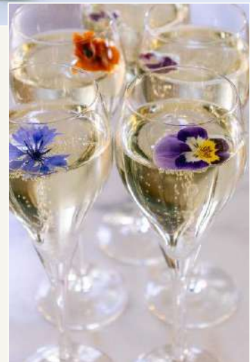
Styling: Florals by Linda Wagner