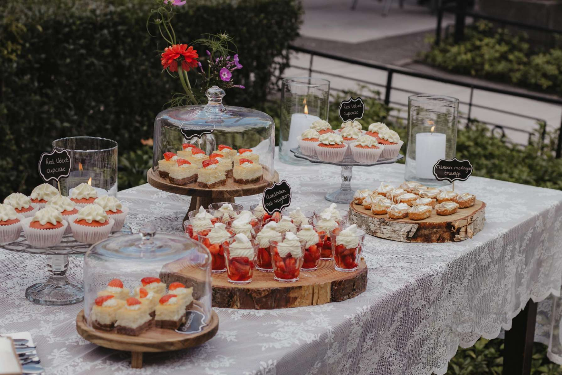
Sweet table: Bibiche's Little Bakery