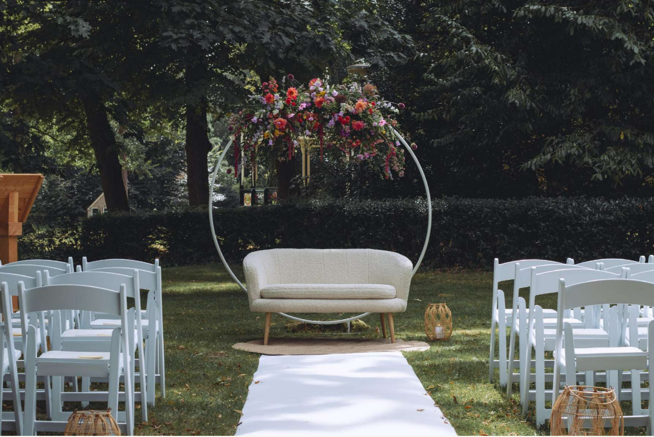
Styling: Florals by Linda Wagner